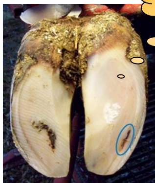
Witte lijn defect